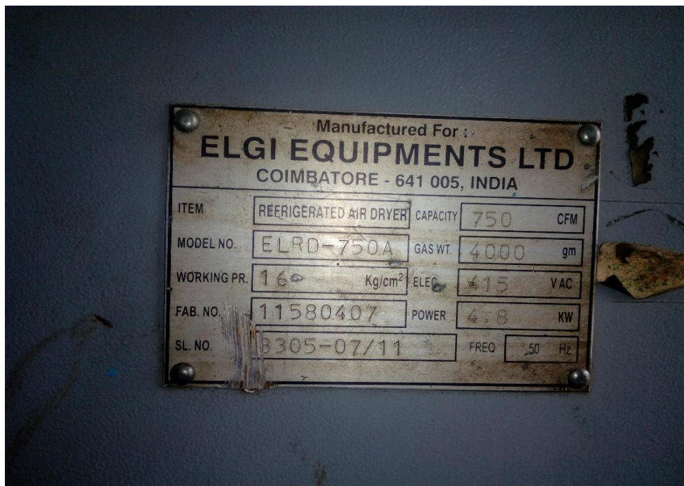
ELGI Dryer ELRD 750A In which Danfoss Make Compressor Is Installed